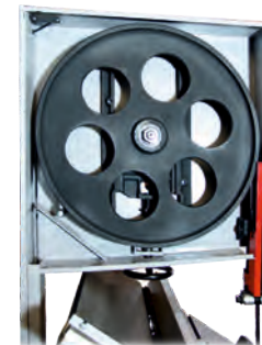
Führungsräder bei HBS610