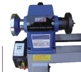
Antriebseinheit mit Handrad