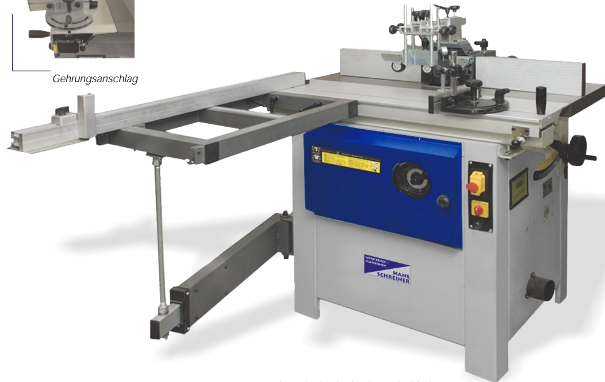
Auslegetisch als Option erhältlich